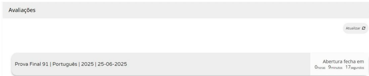
Figura 2 – Acesso à prova a realizar

11.11. Nas provas, ao clicar em “Iniciar sessão”, por exemplo, para um aluno que realiza a prova final de Português (91), aparece o seguinte ecrã: