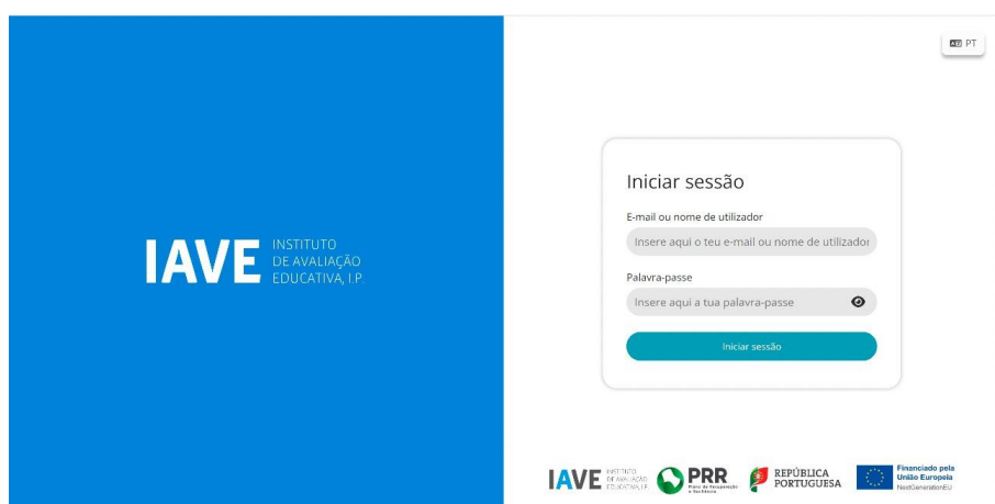
Figura 1 – Acesso à Plataforma de Realização de Provas do IAVE

(Obs.: Para as escolas que optaram pelo offline em rede ou standalone, os procedimentos para acederem à Plataforma de Realização de Provas do EduQA são os constantes no Manual Offline, publicado na Área Escolas do JNE);